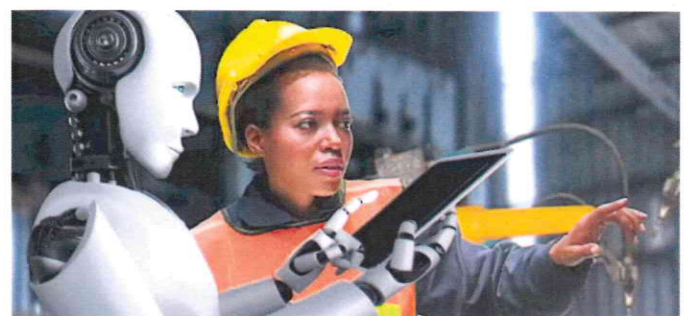
Il rapido sviluppo dell'Intelligenza artificiale rende urgente la riflessione sui temi dell'occupazione e della tutela dei diritti dei lavoratori.